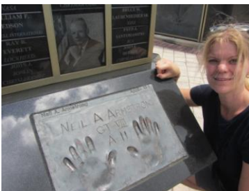
Space View Park