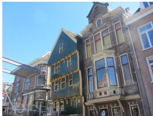
Huis met de Kogel, Alkmaar