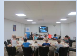
7 mei, Maan SynerKri Krimpen a/d IJssel