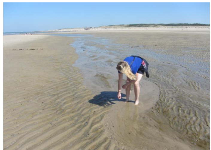
Schelpen verzamelen in Nieuwvliet