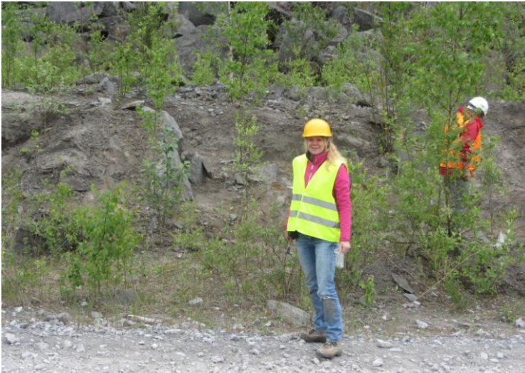
19 mei jl, fossielen zoeken in Soignies (België)