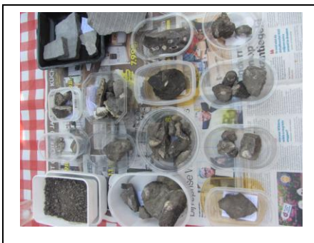
Fossielen groeve Gauthier