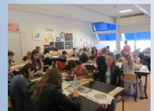
14 mei, Heelal en de Maan in Zoetermeer (schoolproject)